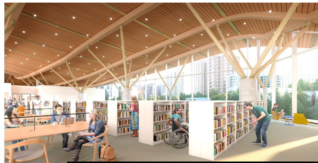
SALLE DE RÉFÉRENCE DE BAC