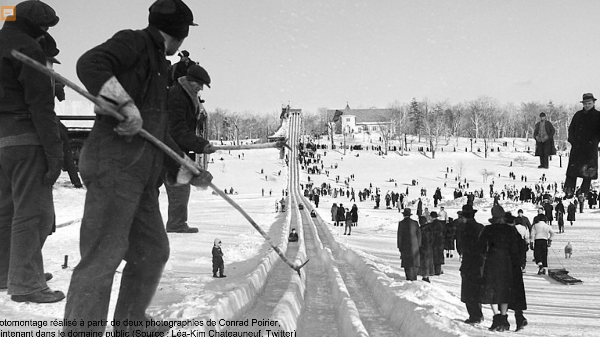
Photomontage réalisé à partir de deux photographies de Conrad Poirier, maintenant dans le domaine public